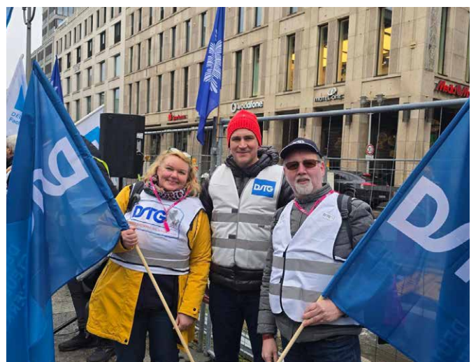
Auch der Bundesvorsitzende Florian Köbler (Bildmitte) war natürlich vor Ort dabei